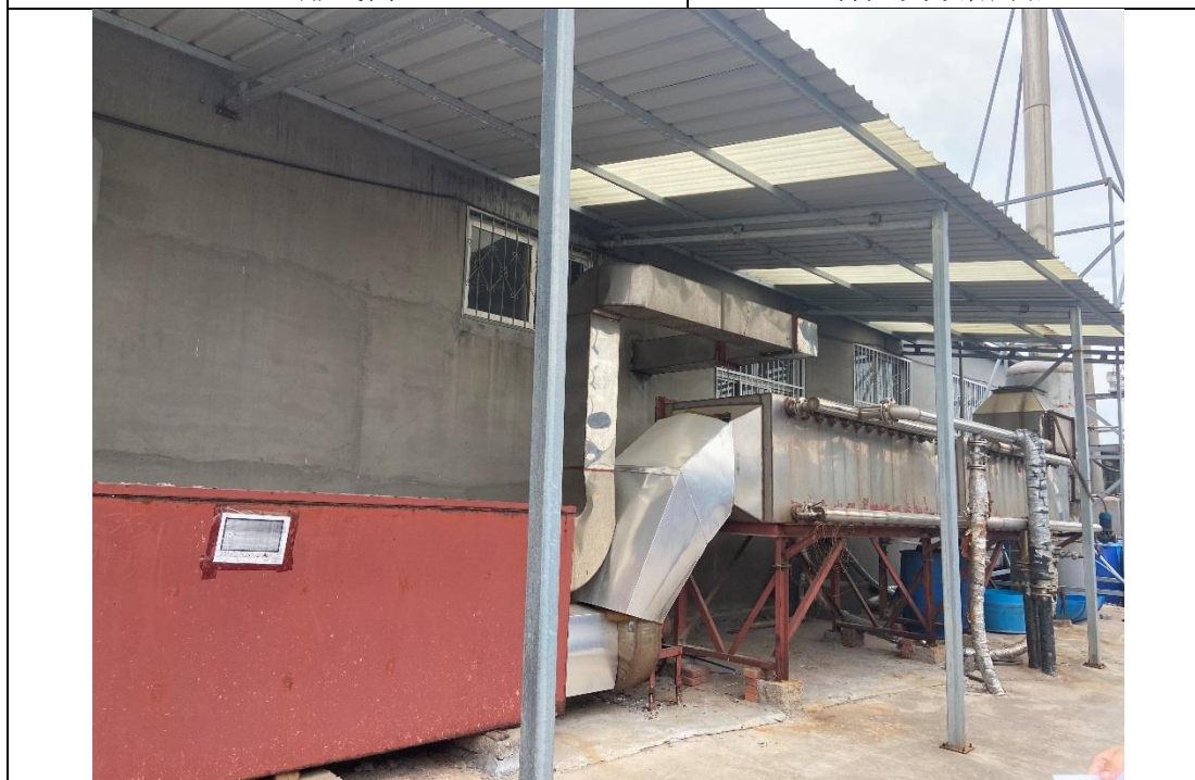
水喷淋+活性炭吸附装置